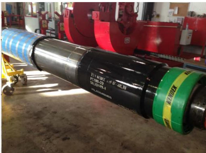
Versaflex Liner Hanger 20"